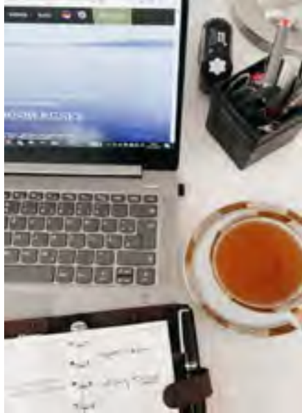
Der Blog rund um Menschen, Orte und den wunderbaren Starnberger See...

HIDEAWAY SECRETS Unsere Mitarbeiter und Blogger, welche eine ganz besondere Verbindung zu unserem HIDEAWAY haben, berichten hier von den schönsten Orten. Weiterlesen oder sogar gleich für zuhause abonnieren auf WWW.THSTARNBERGSEE.DE/BLOG